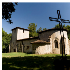
Animé par l'association Saint Michel du Vieux Lugo.