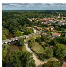
Proposée par la ville de Salles.