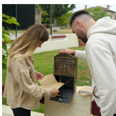
Proposées par l'Office de tourisme du Val de l'Eyre.

Sur le chemin de Saint Jacques de Compostelle, dans un cadre forestier remarquable et magique, ce sobre édifice rural présente d'intéressantes peintures murales médiévales. 2 visites commentées par jour. Après cette visite, n'hésitez pas à découvrir l'Eglise de Mons et son exposition à Belin-Béliet.