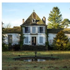
Proposée par la ville de Salles.