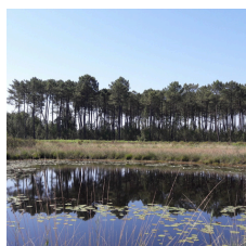
Proposée par la ville de Saint-Magne