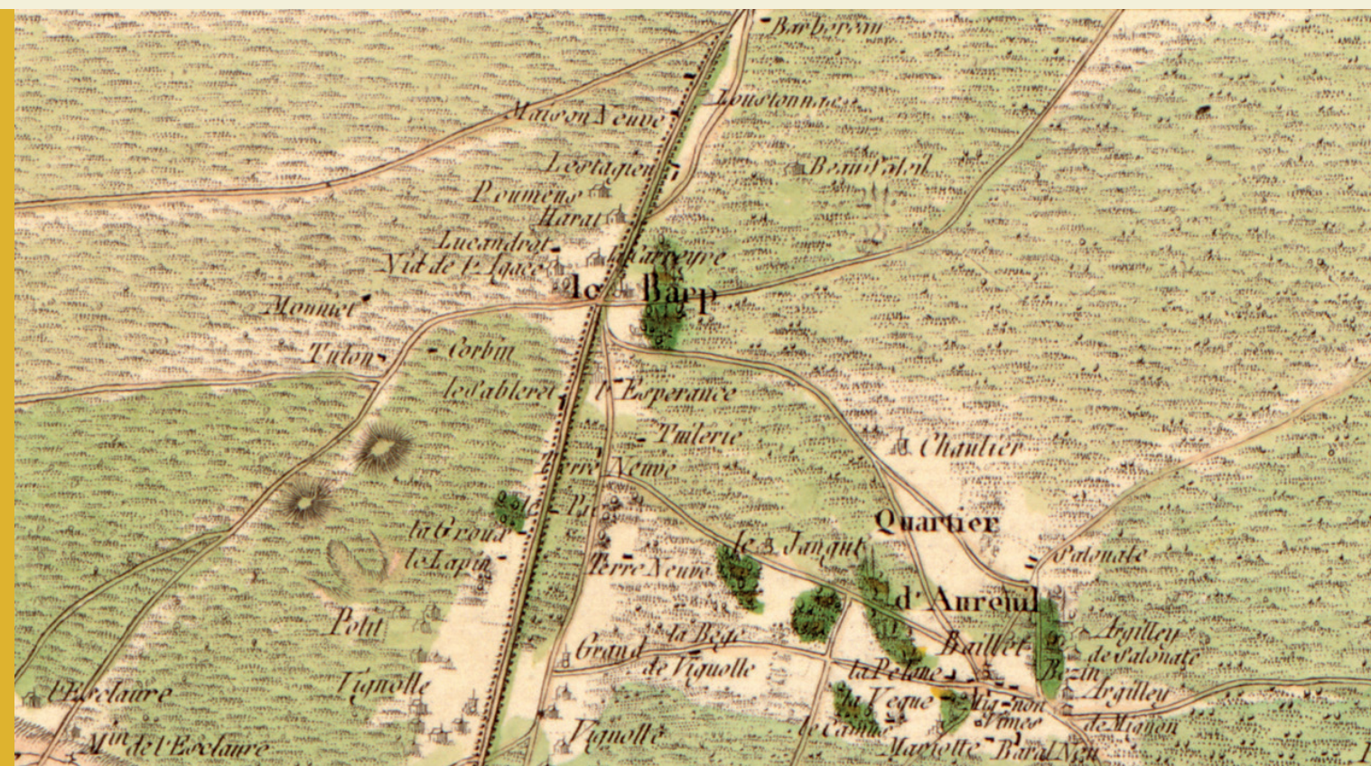
Carte de Cassini n°105 : zoom sur Le Barp, 1756.

Coupé, au premier, parti au I de gueules au prieuré à la tour gasconne couverte et girouettée d'argent, ouverte du champ, maçonnée de sable, flanquée de deux corps de logis couverts aussi d'argent, ouverts chacun aussi du champ, maçonnés aussi de sable, et au II d'or aux deux bourdons de pèlerin d'argent passés en sautoir et à la coquille d'azur brochant en abîme sur le tout, au second d'azur au chêne terrassé d'argent, fruité d'or, à dextre, et au pin terrassé aussi d'argent à senestre, au soleil d'or mouvant du milieu de la partition et à la pomme de pin renversée d'argent en pointe.