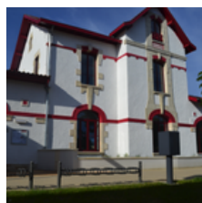
Médiathèque municipale de Salles

4 avenue Plantagenêt 33830 Belin-Béliet 05 56 88 56 99 ludotheque.belinbeliet@orange.fr