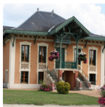
Médiathèque municipale Le Chalet

21 allée Félix Arnaud 33770 Salles 05 56 88 72 35