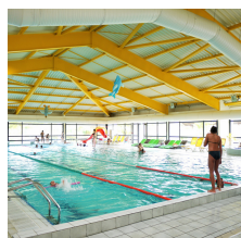
Piscine, bassin d'apprentissage, pataugeoire, toboggan, spas, hammam, centre esthétique...

7 chemin de Calvin Lieu-dit Courgeyre 33770 Salles 05 56 21 42 42 septiemeart.cineode@gmail.com