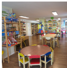
Ludothèque des 4 coins

4 avenue Plantagenêt 33830 Belin-Béliet 05 56 88 19 82 bibliotheque@belin-beliet.fr