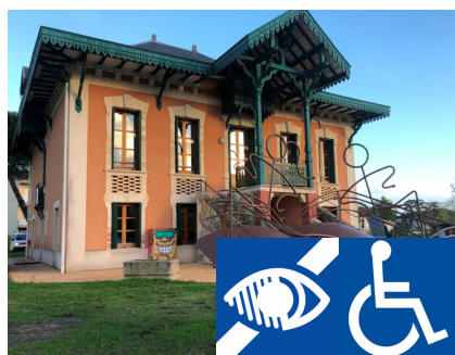
Médiathèque Le Chalet

Adresse : 7 Chem. de Calvin Lieu-dit, 33770 Salles Téléphone : 05 56 21 42 42