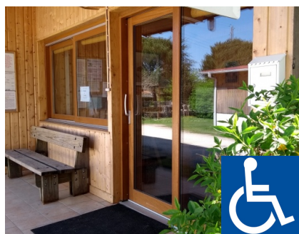
Camping Le Bilos

Adresse : 8 Route de Minoy, 33770 Salles Téléphone : 05 56 88 47 03