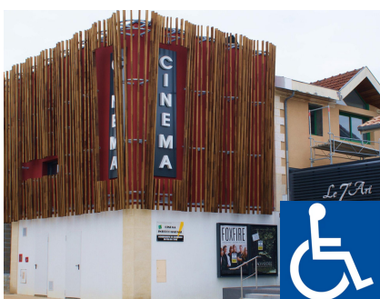
Cinéma le 7ème Art

Adresse : 21 Allée Félix Arnaudin, 33770 Salles Téléphone : 05 56 88 72 35