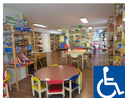
Ludothèque des 4 coins

Adresse : 4 avenue Plantagenêt Immeuble Duc de Normandie 33830 Belin-Béliet Téléphone : 05 56 88 19 82