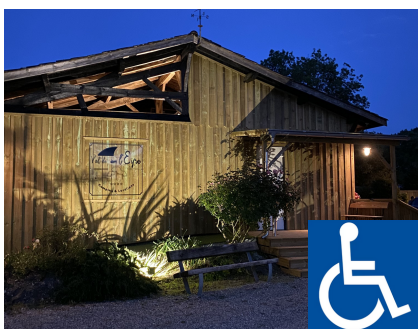
Camping du Val de l'Eyre

Adresse : 68 Av. des Pyrénées, 33114 Le Barp Téléphone : 05 56 88 60 07