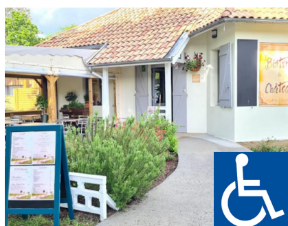
Le Bistro du Château

Adresse : 1 rue Champs de Seuze, 33830 Lugos, Téléphone : 05 57 71 95 28