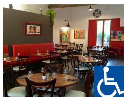
L'Atelier de Chocho

Adresse : 33 Rue du Château, 33770 Salles Téléphone : 05 56 77 11 01