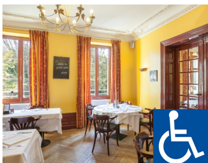
Domaine du Pont de l'Eyre

Adresse : 2 Route de Minoy, 33770 Salles Téléphone : 05 56 88 35 00